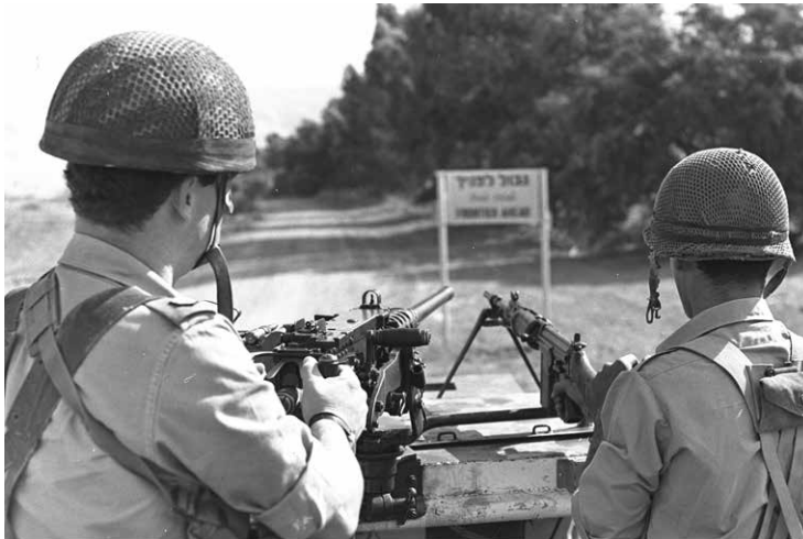
חיילי צה"ל בפטרול על נהר הירדן בעמק הירדן, נובמבר 1968.

היא חייבת להיות מלחמת טיהור. אנו עומדים לשוב לירושלים וירושלים עומדת לשוב אלינו". הדברים שודרו ברדיו קהיר ב-23 באוגוסט ונשמעו גם בישראל. 53 השריפה במסגד אל-אקצא פתחה מסע איומים כלפי ישראל. כבר ביום השריפה נטען ברדיו קול ערב כי "לאחר מה שקרה היום אין הצדקה לאיש להיעדר מצו הג'יהאד (מלחמת מצווה) נגד ישראל". למחרת, באותה תחנת רדיו, שהייתה בעלת השפעה רבה, קראו הפרשנים לפעולה: "יש לרכז את הפוטנציאל הערבי ולהפוך את הזעם לפעולה מעשית ומתואמת. הלחימה הינה דרך התגובה הטבעית על שריפת אל-אקצא. דחף השחרור והג'יהאד הקדוש אצל הערבים והמוסלמים הוא הערכות להחזרת הזכויות לשחרור האדמה", נטען. 54 המופתי של מצרים הזהיר את ישראל גם הוא ממשדרי התחנה: "אלה העושים עוד ידעו מה רעה תהא אחריתם". גם ברדיו קהיר נשמע האיום: "הציונות, ישראל והאימפריאליזם העומד מאחוריהם לא יהיו פטורים מעונש על כך". בתקשורת הירדנית, המשודרת והכתובה, נשמעו מסרים דומים. ברדיו עמאן, כמה שעות לאחר היוודע דבר השריפה במסגד על הר הבית, נאמר: "הגיע הזמן שידעו הנאצים החדשים שאכן הם מהמרים בקיומם. הגיע הזמן שאלה [ישראל] שהציתו אש במולדתנו יכחו באש אותה הציתו. אלה שפגעו בקודש מולדתנו הגיע הזמן שייסרו באש ובברזל. הגיע הזמן שמולדתנו שהייתה תמיד קבר לפולשים דוגמתם, תהיה גם להם קבר אשר ההיסטוריה תצביע עליו בעתיד תוך התפארות. הגיע הזמן שהאצבעות ששחקו באש תשרפנה באש והראשים שלא חשבו אלא על ברזל ואש, שיטעמו מחום הברזל והאש". 55 העיתון הירדני אל-דסתור קרא ב-23 באוגוסט לעם הירדני ולעולם המוסלמי כולו "לנהל מלחמת קודש", ואילו העיתון הירדני אל-דפאע טען ב-24 באוגוסט כי "לא נותרה