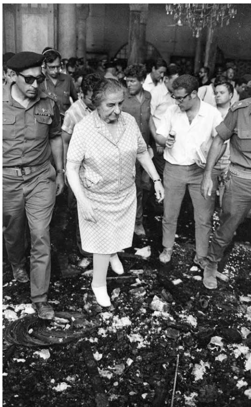
בתוך מסגד אל-אקצא לאחר הרפה.